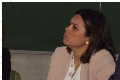
PDF DE LA PONENCIA

La representante de la Federación Andaluza de Agrupaciones de Defensa Sanitaria Ganaderas hizo