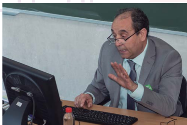
PDF DE LA PONENCIA