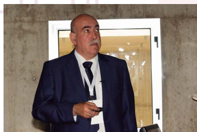
PDF DE LA PONENCIA

El vicepresidente de la Asociación Nacional de Porcinocultura Científica (Anaporc) analizó qué repercusiones ha tenido en la