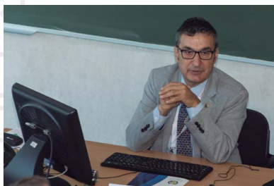
PDF DE LA PONENCIA