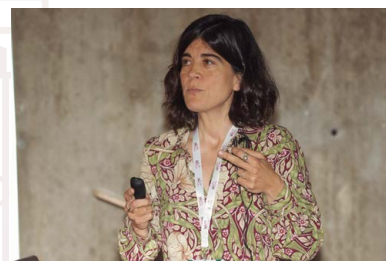
PDF DE LA PONENCIA

La directora técnica de la empresa gerundense Sant Dalmai Food Company analizó la situación de las empresas agroalimentarias. Tras partir de que