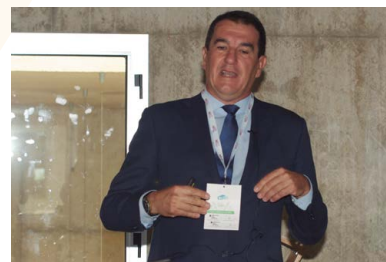
PDF DE LA PONENCIA

El presidente de ANEMBE analizó los problemas a los que se enfrenta actualmente el veterinario clínico práctico en el sector de animales de producción.