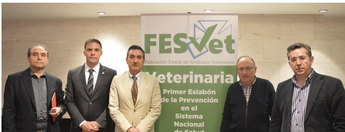
Presentación de la Federación Estatal de Sindicatos Veterinarios en Madrid. 14/05/18

Esta compleja y crítica situación de merma de la calidad de la salud pública comunitaria y desconsideración y discriminación de la veterinaria como profesión sanitaria ha motivado la creación de FESVET.