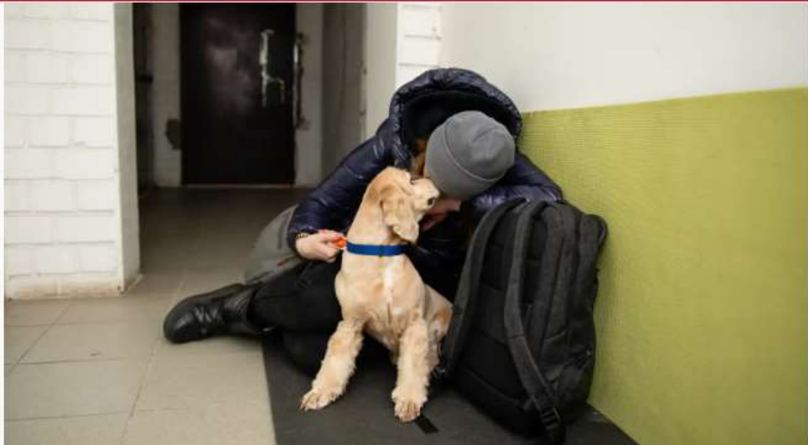
Imagen de archivo de un joven que se refugia de los bombardeos junto a su perro en un sótano.