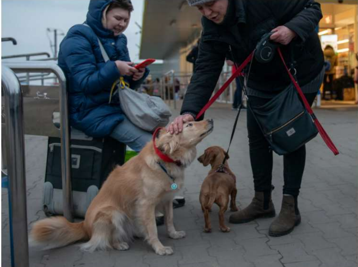
Ucranianos cruzando la frontera con sus animales.