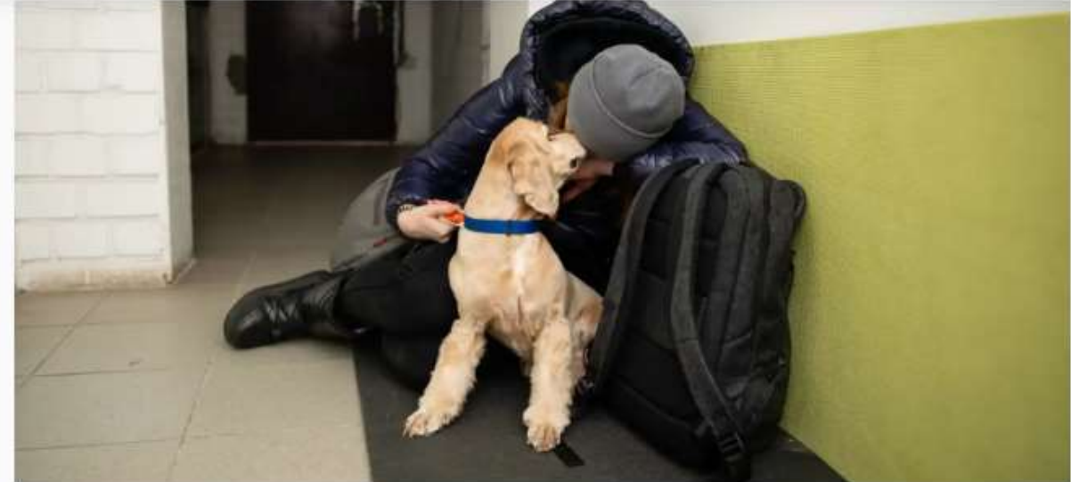
Imagen de archivo de un joven que se refugia de los bombardeos junto a su perro en un sótano.